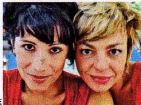
Deux chroniqueuses sur scène.

Les malicieuses chroniqueuses de « Déshabillez mots » se glissent tour à tour dans la peau de leurs convives du dictionnaire, proposant un show didactique, mais surtout drolatique. Le sourire est de mise quand les deux comparses arbo-