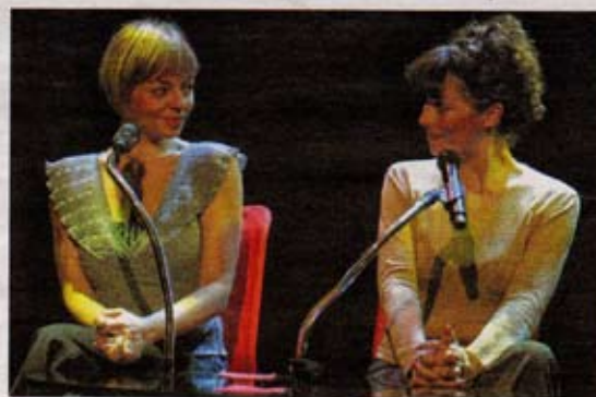
Deux complices malicieuses qui laissent les mots se raconter : surprenant !

Exemple ? La Pusillanimité déclarant avec la morgue un peu lasse